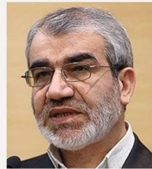
آمریکا این اجازه را دادند.

وی با اشاره به اینکه ما در برگزاری انتخابات در خارج از کشور تابع قوانین کشورها هستیم، اظهار داشت: برخی از کشورها اجازه برگزاری انتخابات را به ما نمی‌دهند؛ مثلاً در دور گذشته کانادا این اجازه را نداد، اما